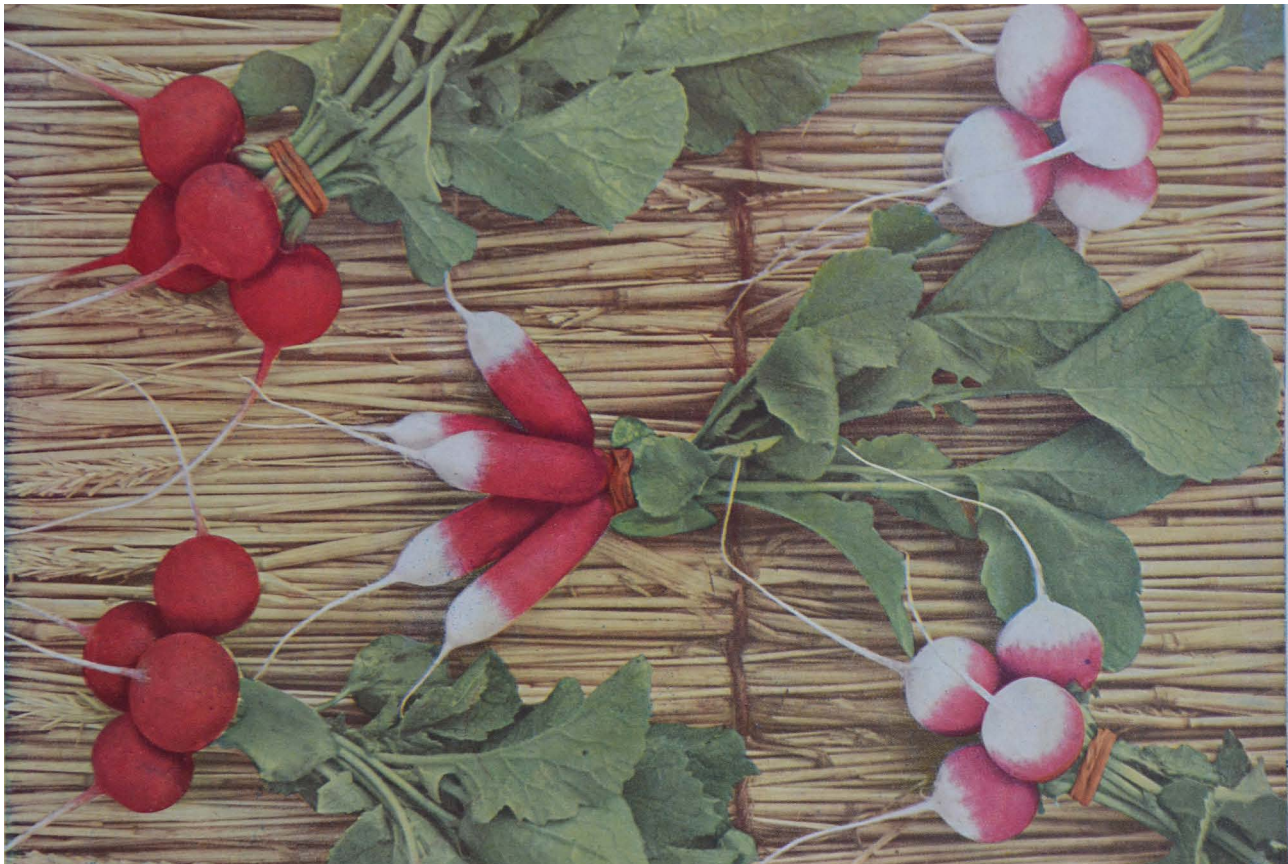
Radisesorter: Øverst fra venstre Non plus ultra og Record. I midten Tidlig fransk forbedret. Nederst fra venstre Saxa og Københavns Torve.

Citat: Haven, årg. 42. 1942. Kbh. I "Art, Varietet og Sort, Kløn, Linie og Stamme" , J. H. Wanscher, s. 100-102.