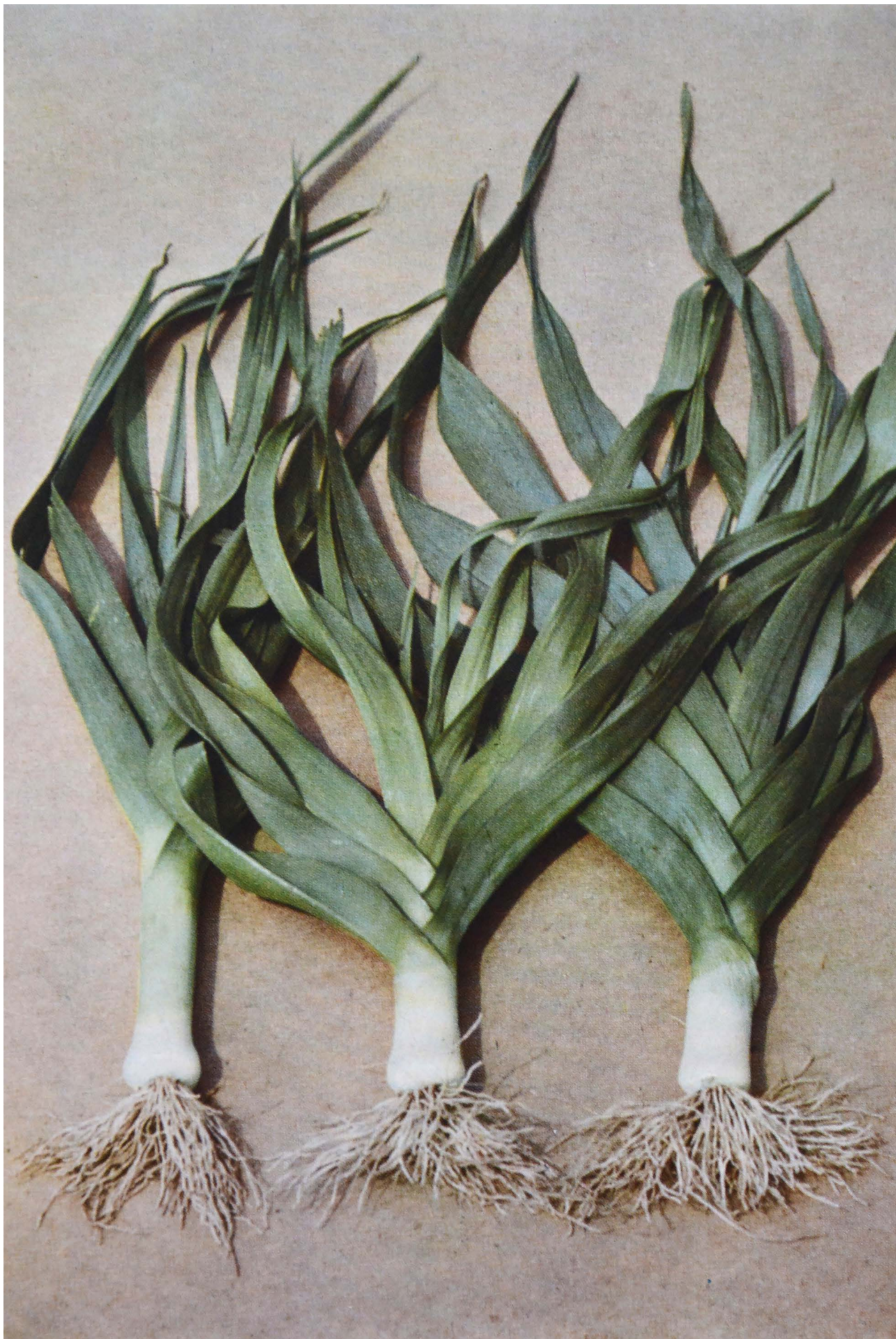
Porresorterne fra venstre St. Jørgen, Poitou og Københavns Torve.